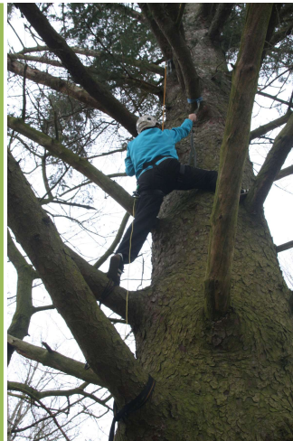
Sitkagraner i denne størrelse kan være fine klatretræer.

Materieludlejning: På trods af den meget lave lejepris går det sløjt med at leje foreningens grej ud til medlemmerne! Foreningen har 1 Lavvu (9 pers.), 2 portaledger (single) og 2 hængekøjer til udlejning.